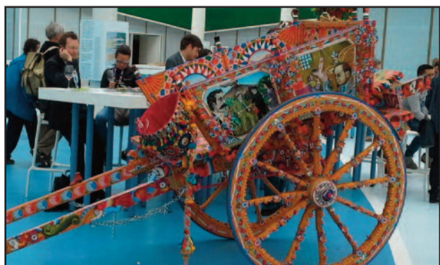
IL TIPICO CARRETTO SICILIANO ALL'EXPO

All'interno del Cluster BioMediterraneo dell'Expo dedicato al West Sicily, Marsala si ricava uno spazio per presentare le sue tipicità. Il prossimo 4 giugno, l'appuntamento è "Marsala Day" che presenterà a Milano la mediterraneità di questa città tra terra e mare. Ed è proprio il rincorrersi di questi due elementi naturali che caratterizza la storia millenaria di Marsala, a partire dai Fenici (397 a.C.) e fino allo sbarco di Garibaldi (1860). Nelle storiche cantine riposa il Vino Marsala. La nobile Doc è un