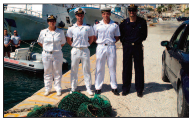
MILITARI DI CORCOMARE CON I RICCI SEQUESTRATI

comunemente chiamato riccio di mare. La normativa di settore prevede che un pescatore sportivo possa pescare un quantitativo massimo di 50 esemplari. Al soggetto, un palermitano, è stata elevata una sanzione di € 4.000, mentre i ricci sono stati sottoposti a sequestro e subito dopo rigettati in mare con l'ausilio di un battello pneumatico della guardia costiera. [ ro. ma. ]