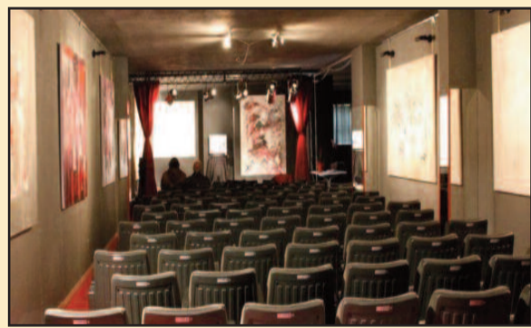
IL BALUARDO VELASCO

Prima dell'inizio della nuova stagione teatrale, lo spazio culturale gestito dall'associazione Baluardo Velasco, in via Frisella, 27, torna con il laboratorio di teatro. Lunedì 5 ottobre, a partire dalle ore 18, l'associazione è pronta ad intraprendere un nuovo entusiasmante viaggio. In quest'occasione si terrà un primo Open Day dove grandi e piccoli potranno sbizzarrirsi nel meraviglioso gioco delle arti teatrali. Per maggiori informazioni chiamare il 334 5778640 o il 328 1359191 oppure scrivete all'indirizzo baluardovelasco@libero.it