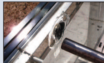
LE LASTRE SBULLONATE

diventasse ben presto "POGGIACULO" per i ragazzi che frequentano quell'area. Il peso del sedere si scarica sul vetro e lo manda in frantumi. Ho suggerito di porre un rimedio collocando dei sostegni in acciaio inox per scaricare il peso sul pavimento e non sul vetro. Ma i tecnici del nostro Comune o non sanno, o non vedono e tanto meno sono disposti ad accogliere