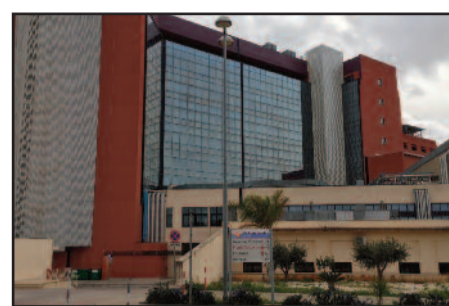
OSPEDALE "P. BORSELLINO" DI MARSALA

nuncia, ma hanno avvertito la stampa, inviando anche le foto scattate. Una settimana fa c'era stata un'altra segnalazione simile: una famiglia aveva pubblicato su Facebook la foto di un piatto fornito dal servizio di refezione dell'Asp di Trapani in cui si notava la presenza di un insetto. L'Asp di Trapani ha aperto un'indagine interna e ha anche inviato i propri tecnici nella sede dell'azienda che fornisce i pasti per un'ispezione volta a far luce sull'episodio.