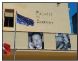
TRIBUNALE DI MARSALA