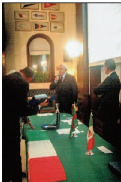
UN MOMENTO DELLA PREMIAZIONE

petenza. La sua partecipazione in giurie nazionali ed internazionali in Italia e all'estero è vasta e per oltre quarant'anni ha dato e continua a dare lustro alla nostra vela nazionale grazie alle ottime conoscenze del regolamento di regata e alle maniere procedurali nelle udienze. Nella qualità di giudice internazionale, ha servito il nobile spot della vela negli Stati Uniti, in Canada in Sud America e in tutta l'Europa. Ha fatto parte delle giurie nella "Coppa del Re", della "Giraglia", della "Barcolana", della "Sardinia Cup", della "Middle Sea Race", della "Coves Week", della "Palermo Montecarlo". Nel settore olimpico ha presieduto, sia a livello nazionale che internazionale i più prestigiosi campionati europei e mondiali. Tre anni fa il CONI gli ha conferito la stella al merito sportivo.