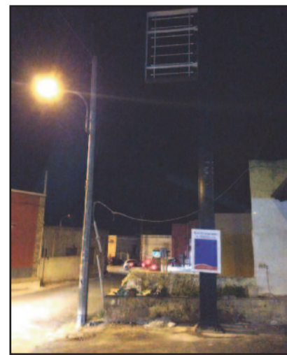
L'INCROCIO DI CONTRADA PAOLINI