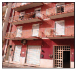
IL PALAZZO DI VIA COLOCASIO

Ieri pomeriggio, intorno alle 17, un incendio si è sviluppato all'interno del secondo piano di una palazzina in via Colocasio - all'altezza del civico 32 - di fronte l'ex ospedale San Biagio. Sul posto sono intervenuti i Vigili del Fuoco provenienti da Mazara del Vallo. Non si conosce al momento in cui scriviamo, la causa che ha provocato l'incendio.