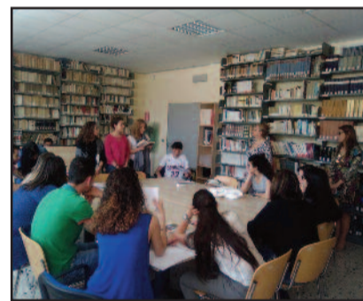
UN MOMENTO DELL'INIZIATIVA