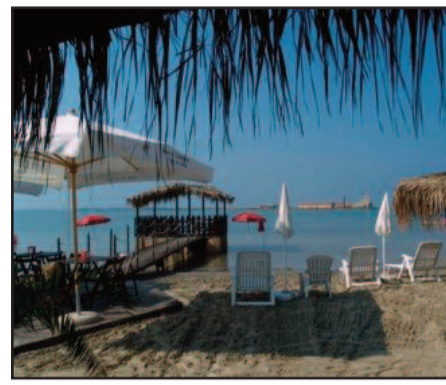
LIDO SAN TEODORO