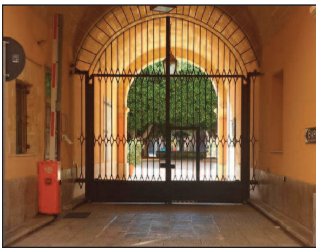
L'INGRESSO DEL PALAZZO MUNICIPALE