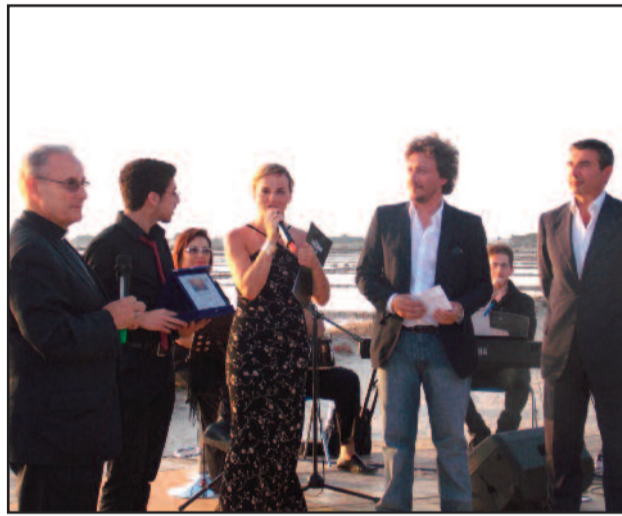
UN MOMENTO DELLA PASSATA EDIZIONE