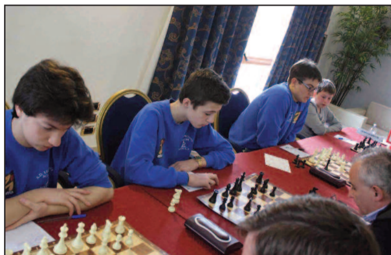
LILYBETANA UNDER 16