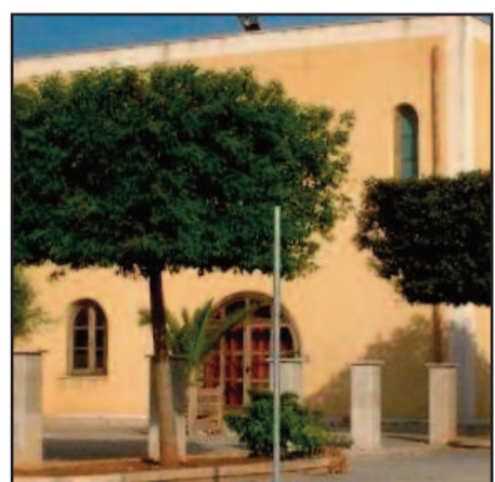
CENTRO POLIVALENTE DI PETROSINO