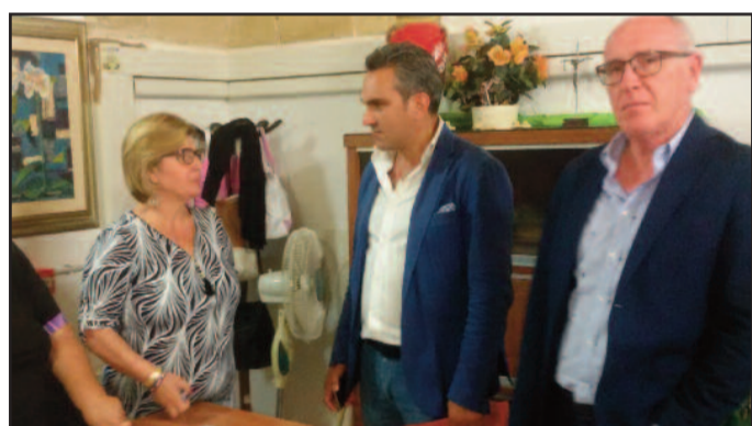
UN MOMENTO DEL SOPRALLUOGO