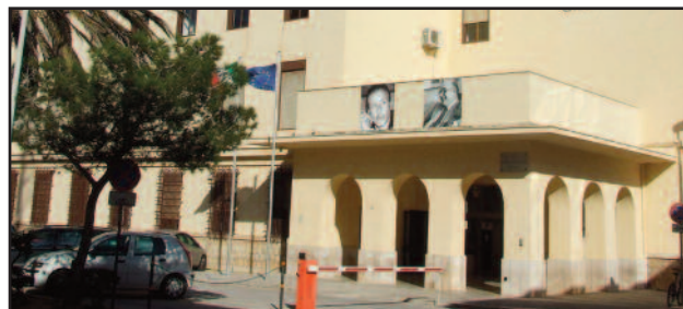
TRIBUNALE DI MARSALA

giudicato con il rito abbreviato, per cui la sua posizione è stata stralciata dal resto del procedimento. La discussione dell'abbreviato si è tenuta davanti al giudice monocratico Matteo Giacalone e ha visto costituite parti civili sia l'Enel che il Comune di Trapani. Secondo l'accusa le sei persone arrestate erano responsabili di aver rubato quattro tonnellate di rame provocando anche l'interruzione del servizio della pubblica illuminazione: in quattro hanno poi chiesto