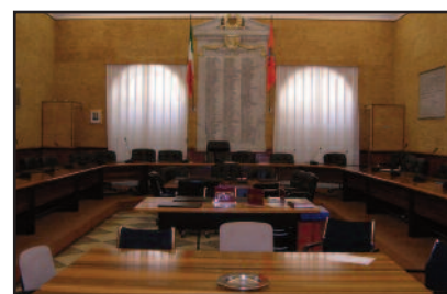
AULA CONSILIARE DI MARSALA