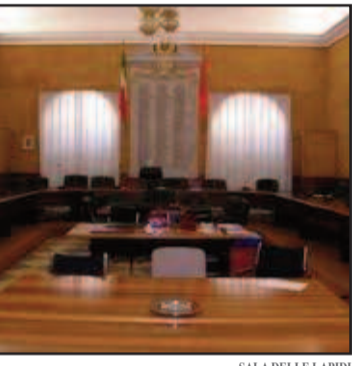
SALA DELLE LAPIDI