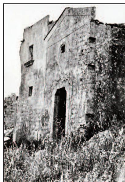
LA FACCIATA DELLA DISTRUTTA CHIESA DELLA SACRA FAMIGLIA DI CARILLUMI

secoli della dominazione araba nel territorio di Marsala esistevano dei villaggi abitati da Bizantini, ossia da siciliani di lingua greca e religione cristiana. Ma se il significato del toponimo è chiaro, rimane incerto quale fosse il luogo centrale del casale. Premesso che l'indagine archeologica ha quasi del tutto ignorato la campagna lilibetana, possiamo ricordare che negli anni '80 del secolo scorso, durante i lavori di scasso per l'estirpazione di un vigneto in contrada Loconovo, che si trova a monte di Carillumi, sono venuti alla luce numerosi blocchi quadrati di tufo intonacati che lasciano presupporre l'esistenza di un complesso edificio di notevole mole. Tutto il terreno circostante per un largo tratto è cosperso da un'enorme quantità di frammenti di tegole e di ceramica, che consentono di datare il complesso alla tarda età romano imperiale. Ma l'esplorazione di superficie e l'osservazione dei numerosi cocci di ceramica che si trovano sparsi qua e là lungo l'alta valle del Sossio consentono di individuare altri siti archeologicamente interessanti che attestano l'antichità e l'abbondanza di abitazioni in quella vallata. Ritengo, perciò, sulla base di queste osservazioni, che tutta quell'area, con i vari siti individuati, sia da identificare con il Casale dei Bizantini. In età moderna a Carillumi, come in molte altre contrade marsalesi, furono costruiti torri, chiese, bagli ed edifici di abitazione, i cui resti sono ancora visibili.