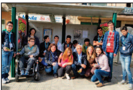
I RAGAZZI DEL COSENTINO DURANTE IL SOPRALLUOGO A PIAZZA DEL POPOLO