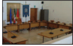
AULA CONSILIARE DI PETROSINO