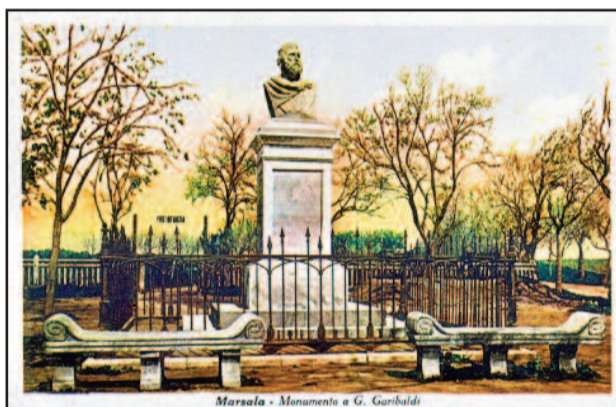
Marsala - Monumento a G. Garibaldi