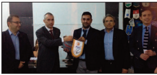
UN MOMENTO DELLA CONSEGNA DI UN DEFIBRILLATORE