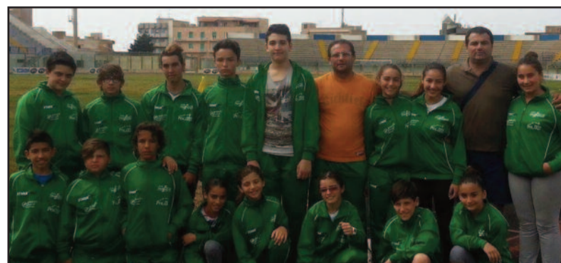
GLI ATLETI DELL'ASSOCIAZIONE "NUMBER ONE"