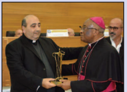
UN MOMENTO DELLA CONSEGNA DEL PREMIO