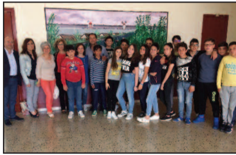
UN MOMENTO DELL'INIZIATIVA