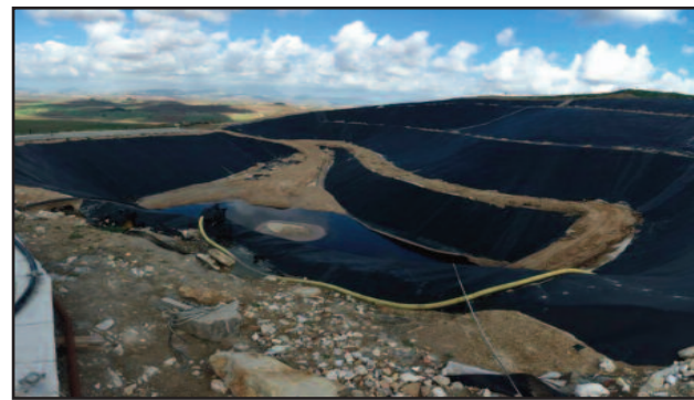
LA DISCARICA DI BORRAENA