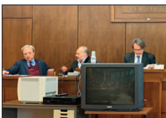
della giusta durata dei processi, anzi rischia, secondo l'avvocatura, di peggiorare le condizioni attuali. Sulla