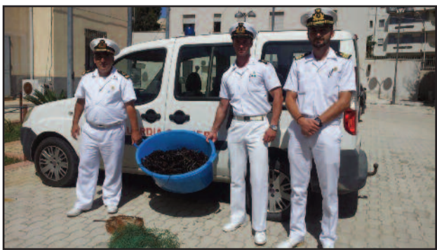
GLI UOMINI DI CIRCOMARE CON I RICCI SEQUESTRATI