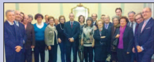
I SOCI DEL ROTARY CLUB MARSALA