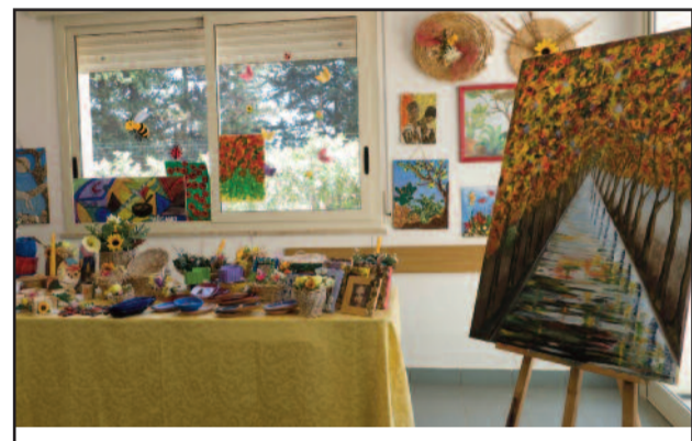
UN MOMENTO DELLA MANIFESTAZIONE

dell'impiego della manodopera extracomunitaria nel settore primario anche in Europa, in questo senso si è espresso Piergiorgio Sciacqua, co-presidente di Eza, il Centro Europeo per le questioni dei lavoratori: "L'Europa ha il dovere, nel momento in cui li accetta sul proprio suolo, di provvedere alla loro istruzione di base ed alla formazione professionale". L'EZA, assieme a Feder.Agri e MCL, opera già da qualche tempo su questo fronte con una rete composta da 69 organizzazioni di lavoratori, presenti in 26 diversi Paesi per abbattere le "frontiere immaginarie" rette ancora su vecchi stereotipi. I lavori del seminario sono stati accompagnati da visite guidate a Mozia, nel centro storico lilybetano ed alle cantine. Al termine della due giorni è facile affermare che: "L'Africa ha bisogno dell'Europa nella stessa misura in cui il Nord ha bisogno del Sud".