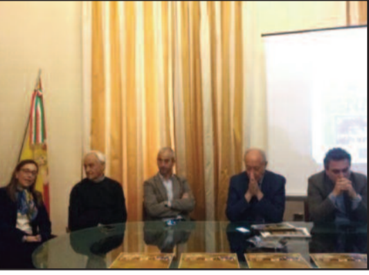
UN MOMENTO DELLA CONFERENZA STAMPA