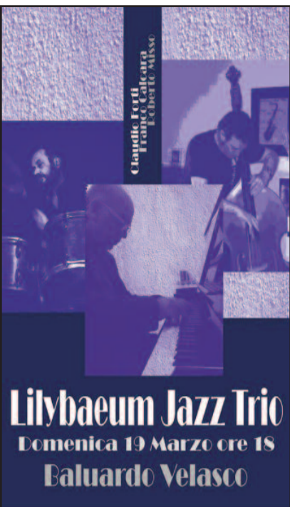
Lilybaeum Jazz Trio Domenica 19 Marzo ore 18 Baluardo Velasco