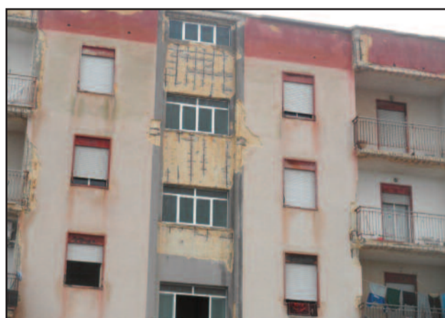
LA PALAZZINA DI SAPPUSI

bagni delle abitazioni infiltrazioni d'acqua stanno causando danni ben peggiori. Il quadro che ne emerge è una situazione davvero precaria col rischio che si possa mettere in pericolo l'incolumità di cose ma soprattutto di persone. Peraltro nella Palazzina insistono le impalcature montate dall'Istituto Autonomo Case Popolari che però, tra vento, acqua e forte scirocco, sono fortemente segnate dall'usura andando anche a fuoco. Va ricordato che i soldi per ristrutturare la palazzina ci sono: 700mila euro e i lavori erano già appaltati ma ancora non eseguiti in quanto imbrigliati in svariati problemi tra Comune e Regione. Da marzo ad oggi solo piccoli passi. L'IACP, proprietario dell'immobile in questione, aveva fatto sapere che "... il ripristino