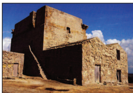
LA TORRE DI SAN TEODORO

veloce il suo flusso e riflusso dell'acque, che ogni sei hore sale e scende, che non c'è fumarina in questo regno, che porti maggior velocità et repentina di quello. [...] Questa isola del Burrone... per esser di poca superficie, quando il mare talvolta s'adira, la divide in tre parti... Ed entrati nello stagnone, che... comincia dalla punta di Santo Teodoro et si trova abbracciato dalla parte di fuori della detta isola et dalla parte di dentro... [dalle] Timpe dello Spagnolo... vi sono quattro isolette: la prima chiamata Cernedisi, la seconda di Santa Maria, la terza di Santo Pantaleo et la quarta della Scuola, tutte seccagne". Camilliani accenna poi a quel canale artificiale, chiamato la Patulilla, che fu chiuso nell'Ottocento dai proprietari delle saline dell'Isola Lunga, con grave danno della circolazione delle acque dello Stagnone: "Ben è vero ch'alla costa d'essa isola alla parte di dentro... c'è un canaleto, il quale si crede che sia stato artificioosamente fatto, acciochè le barchette, che passano da Trapani a Marsala et da Marsala a Trapani, tutte passino per quello stagno, perché dalla parte di fuori v'è