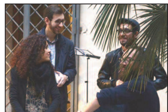
IFONDATORI DE L'INSONNE

in via Orfani 48 Trapani. All'associazione ci si può rivolgere anche per eventuali contributi ed è, inoltre, possibile rilasciare un'offerta nei punti in cui il bimestrale viene distribuito. L'Insonne nasce in una "fucina creativa" che comprende altre iniziative, ma anche artisti e associazioni del territorio. Cosa bolle in pentola? Concerti di musica indipendente, laboratori, cineforum, circoli di lettura, nonché il "Pagliorum", rassegna teatrale in campagna, sono solo alcune delle iniziative portate avanti in questo momento a Trapani da diverse realtà artistiche che tramite la cultura mirano a realizzare ciò che Mauro Rostagno auspicava circa 30 anni fa: "creare una società in cui valga la pena trovare un posto". Espressione di questo fermento è "La Nassa", un ampio progetto di rinnovamento culturale che include anche il bimestrale. E' in atto un risveglio che sta ridestando la Sicilia e La Nassa e L'Insonne vogliono provare a essere parte di questa rifioritura offrendo a una terra finora letargica, occhi svegli, penne pensanti e mani sporche dal fare. [audrey vitale]