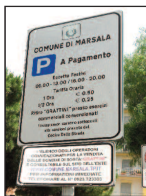
UN CARTELLINO IN PIAZZA MARCONI

C ontinue lamentele ci provengono dai cittadini circa il parcheggio nelle strisce blu. Con la nuova ordinanza sindacale infatti, non è più obbligatorio che venga affisso dagli ausiliari del traffico il foglio con il quarto d'ora di tolleranza e se gli automobilisti devono "assentarsi" per acquistare le park card, devono munirsi di disco orario, in caso contrario se in quel momento passano i controllori e l'auto non è munita di "grattini", scattano le multe. E diversi sono i casi accaduti in quanto molti cittadini affermano di non essere a conoscenza delle nuove disposizioni, nonostante l'Amministrazione ne abbia dato comunicazione tramite i mezzi di comunicazione. Ma forse non a tutti è giunta la novità. Molti lamentano anche che non è stato elevato il verbale di contestazione ricevendo direttamente a casa la multa.