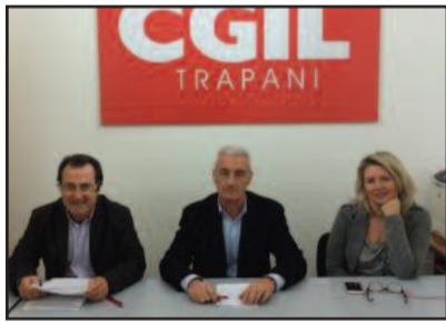
I SEGRETARI DELLA CGIL DI TRAPANI