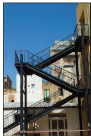
LA SCALA D'EMERGENZA