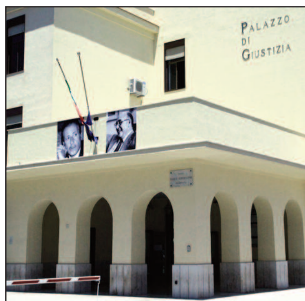
TRIBUNALE DI MARSALA