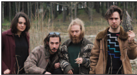
LA "FILARMONICA MUNICIPALE LACRISI"

Dopo il concerto una ricca apericena con prodotti enogastronomici offerta da alcune aziende marsalesi: Dolce Tentazione, Non solo pane, Pizza al tegamino e Panificio Pellegrino. Sponsor della rassegna le cantine Caruso e Minini e l'azienda marsalese 3cel. Media partner di BaluArte radio Itaca, il portale itacanotizie.it, il quotidiano Marsala C'è e il portale turistico VisitMarsala. Tutte le informazioni al Botteghino del Baluardo Velasco Espacio Teatral aperto ogni pomeriggio dalle 17 o scrivendo a info@baluardovelasco.it. Info telefoniche: 0923.1954368 - 334.5778640. Ingresso posto unico €15,00.