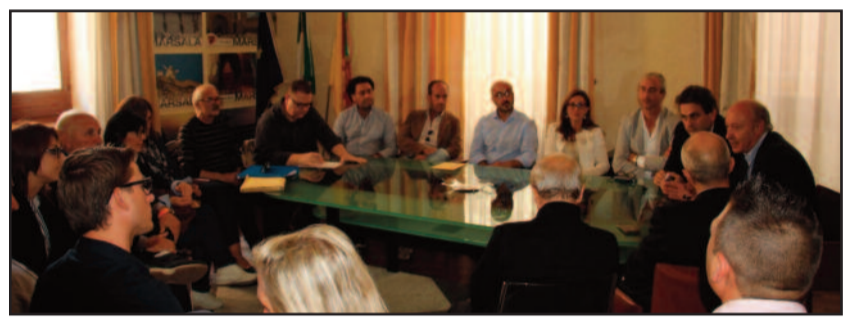
UN MOMENTO DELLA RIUNIONE SINDACALE