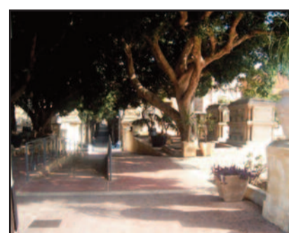
L'INTERNO DEL CIMITERO DI MARSALA

Foscolo rimarrà chiuso dalle ore 7 di venerdì 30 ottobre e fino alle ore 7 del giorno successivo (31 ottobre 2015) per le operazioni di pulizia straordinaria. Altre norme inserite in determina riguardano le accensioni di ceri e altri corpi illuminanti che devono essere attuate osservando le opportune cautele; il divieto di occupare il suolo antistante i loculi con sedie, cavalletti e altro materiale e tenere la destra durante il transito in prossimità dei cancelli per facilitare l'ingresso e l'uscita dal sacro. Infine è fatto assoluto divieto di accedere con veicoli all'interno del