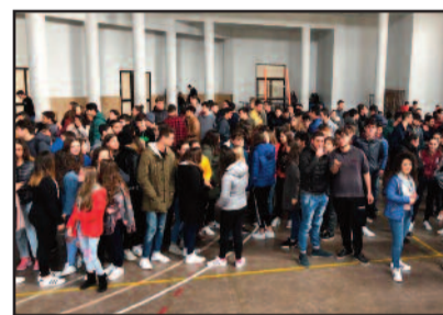
alunni di un'istituzione scolastica di aver garantito un diritto inviolabile come quello di svolgere regolarmente le normali attività.

lentina Civello - visto l'immobilismo del Libero Consorzio Comunale di Trapani in merito alla sistemazione della palestra di questo Istituto, chiusa ormai da più di un mese e mezzo, con la conseguente impossibilità di fruizione della stessa da parte delle 40 classi, con la presente dichiarano lo stato di agitazione della rappresentanza studentesca di questo istituto. "E' una cosa inaccettabile e non più sopportabile che, a causa di una burocrazia lenta e inefficiente, la palestra rimanga ancora chiusa e non si permetta ai 900