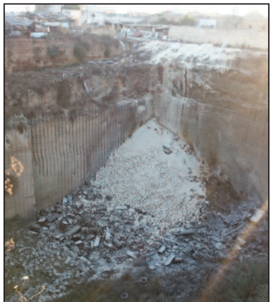
NELLE FOTO LA CAVA DI VILLA PETROSA

un danno ambientale che potrà essere sanato solo in seguito a un radicale intervento di bonifica. Anche perchè, la cava era diventata nel tempo una discarica abusiva a cielo aperto, in cui era stato illecitamente riversato di tutto: copertoni, sanitari, frigoriferi, lavatrici, mobili da cucina, materiale di imballaggio, reti, materassi, lampade per uso industriale, sacchi di rsu e numerosi frammenti di eternit. Il rogo ha quindi prodotto - e continua a produrre - esalazioni acide, che da due settimane non danno tregua alle circa 40 famiglie che risiedono a Villa Petrosa. Il rischio, però, è che sia stata pesantemente intaccata anche la falda acquifera, con conseguenti danni per le contrade limitrofe (Sant'Anna, Torre Maccubo, Santo Padre) e