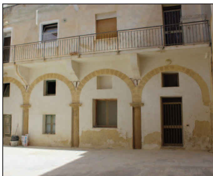
IL CHIOSTRO DEL CONVENTO DI SANT'ANTONINO, U JARDINEDDU