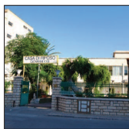
LA CASA DI RIPOSO "GIOVANNI XIII"