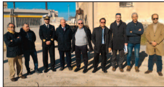
FOTO DI GRUPPO DOPO LA CERIMONIA DI CONSEGNA DELLA PRIMA AREA