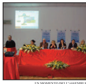
UN MOMENTO DELL'ASSEMBLEA