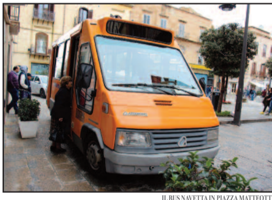
IL BUS NAVETTAIN PIAZZA MATTEOTTI

Tragitti che collegano i cittadini al proprio posto di lavoro o alle scuole in cui accompagnano i figli si trasformano spesso in percorsi ad alto coefficiente di difficoltà, con tempi di percorrenza sempre più lunghi. Consapevoli di ciò le amministrazioni di Alcamo, Calatafimi-Segesta, Petrosino e Marsala hanno deciso di unire le forze e di presentare un elenco di interventi mirati sul fronte della "mobilità sostenibile casa-scuola e casa-lavoro", il programma sperimentale promosso dal Ministero dell'Ambiente, della Tutela del Territorio e del Mare. Il progetto della coalizione comunale - un bacino territoriale di oltre 100 mila residenti - si chiama "Muoviti Bene che ti Premio" ed è stato inviato a Roma, alla Direzione Generale per il Clima e l'Energia, per concorrere al finanziamento che prevede uno stanziamento nazionale di 35 milioni. Il programma ambientale comune (di cui Marsala è capofila) intende sostenere un miglioramento qualitativo e culturale dell'uso dei mezzi privati per muoversi in città, incentivando scelte di mobilità alternative per gli spostamenti casa-scuola e casa-lavoro. Sensibilizzare gli automobilisti a lasciare parcheggiato il veicolo, favorendo così l'uso di mezzi pubblici elettrici, comporterà altresì migliori servizi per i cittadini, sia utilizzando tecnologie informatiche che puntando su campagne di informazione ed educazione alla mobilità sostenibile. L'investimento complessivo del progetto in partenariato è di oltre 1 mi-