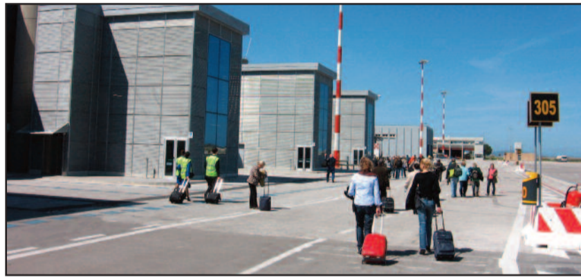
LA PISTA DELL'AEROPORTO "V. FLORIO"