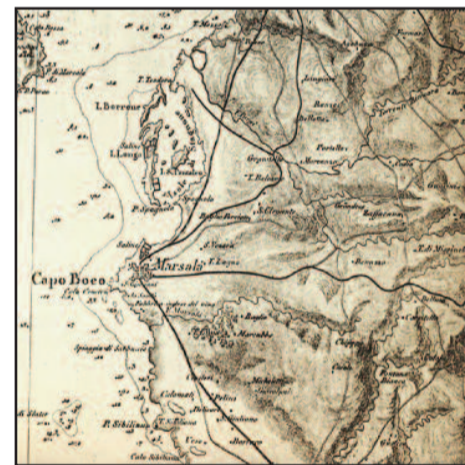
W. H. SMYTH, CARTOGRAFIA DELLA COSTA OCCIDENTALE DELLA SICILIA (THE HYDROGRAPHY OF SICILY)

teramente cosparso di cocci di terracotta e di antichi mattoni. Fra le altre rarità trovate vi sono alcuni singoli tubi di piombo, che comunicavano con la terraferma, probabilmente sopra la famosa strada rialzata ...". È significativo il fatto che, quando ancora gli intellettuali siciliani discutevano sull'esatta collocazione di Mozia, il capitano Smyth avesse individuato nello Stagnone l'antica colonia fenicia e l'avesse messa in relazione con l'araba Zezabug. Continua poi lo Smyth: "L'isola attualmente appartiene ai gesuiti, ai quali era stata confiscata; ma alla rinascita dell'ordine in Sicilia, il Principe [Giuseppe Beccadelli Bologna, Principe di Camporeale], allora in possesso di essa, volontariamente la restituì. Questa isoletta ha una circonferenza di circa un miglio e mezzo ed è abitata da circa centocinquanta persone: essa è molto salubre e abbondantemente fertile, essendo notevole per il suo delizioso vino e per il gusto dei suoi fichi. La sua bella posizione, come se fosse in lago, sarà meglio compresa esaminando la pianta contenuta nell'atlante, la quale mostrerà anche la saggezza dei Saraceni nello stabilirvi una peschiera. Cernisi e