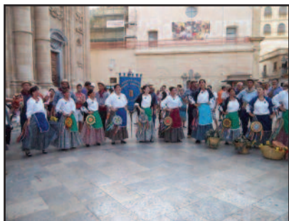
IL GRUPPO FOLKLORISTICO TORRE SIBILIANA

Il gruppo folkloristico "Torre Sibiliana città di Petrosino" è stato invitato a rappresentare l'Italia all'evento "International Folk Dance Festival Play in Barcelona" che si terrà dal 30 giugno al 5 luglio in Spagna, nella città di Lloret de Mar. Al festival parteciperanno molti gruppi folk, provenienti dalla Serbia, Turchia, Armenia, Grecia, Bulgaria e Polonia. Il gruppo folkloristico Internazionale delle antiche tradizioni popolari siciliane "Torre Sibiliana" nasce a Petrosino