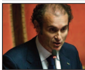
VINCENZO MAURIZIO SANTANGELO

Ieri mattina, il portavoce al Senato del Movimento 5 Stelle, Vincenzo Maurizio Santangelo, si recherà presso la base militare dell'Aeronautica del 37° Stormo di Trapani-Birgi, per incontrare il Comandante Colonello Luca Capasso e per conoscere e verificare l'apparato logistico della base. Qualche giorno fa il senatore penta stellato era intervenuto sulle esercitazioni Nato che si svolgeranno proprio nella base di Trapani Birgi nell'ambito della operazione "Trident Juncture" 2015 che si doveva svolgere in Sardegna. Al fine di ricevere dei chiarimenti sui motivi di tale scelta, nei giorni scorsi il Movimento 5 Stelle ha presentato, in Senato, una interrogazione a prima firma dell'onorevole Santangelo al Ministro della Difesa Pinotti.