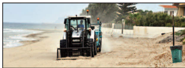
UN MOMENTO DELLE PULIZIE SUL LITORALE SUD MARSALESE