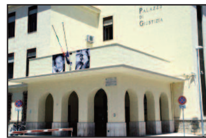
TRIBUNALE DI MARSALA