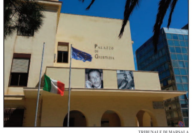
TRIBUNALE DI MARSALA