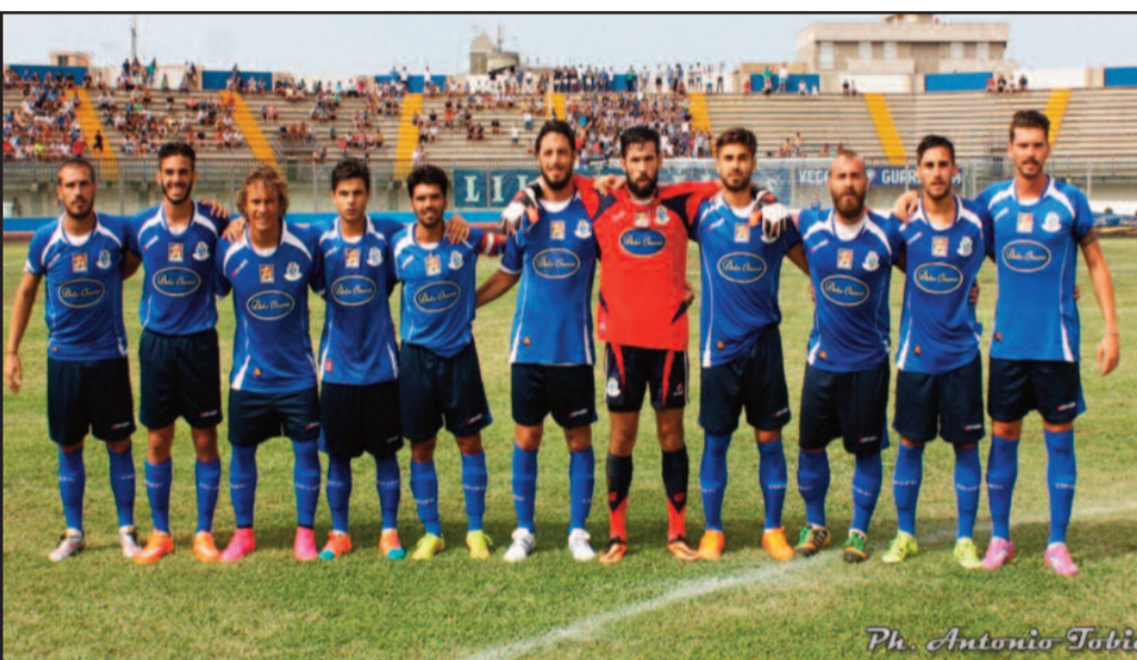
SPORT CLUB MARSALA 1912