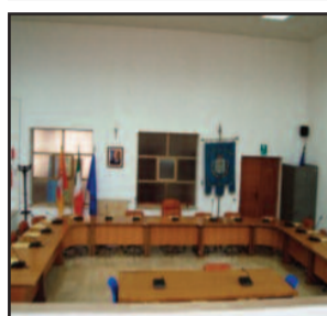
AULA CONSILIARE DI PETROSINO