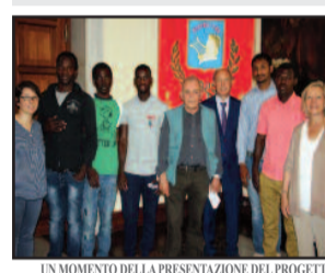
UN MOMENTO DELLA PRESENTAZIONE DEL PROGETTO