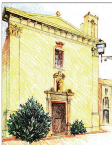
CHIESA DI SANT'ANTONINO, PASTELLO A CERA DI P. GIACALONE

un totale di 38 edifici sacri, anche se non tutti erano funzionanti. E poiché la città contava 7500 abitanti, avevamo una chiesa ogni 197 abitanti. Sono compresi nel numero 4 conventi maschili ed uno femminile, quello benedettino di San Pietro, riservato alle figlie del notabilato cittadino e insufficiente alle esigenze della città. Ricordiamo a questo proposito che i monasteri femminili di San Girolamo e Santo Stefano saranno costruiti soltanto alcuni decenni più tardi. (cont.)