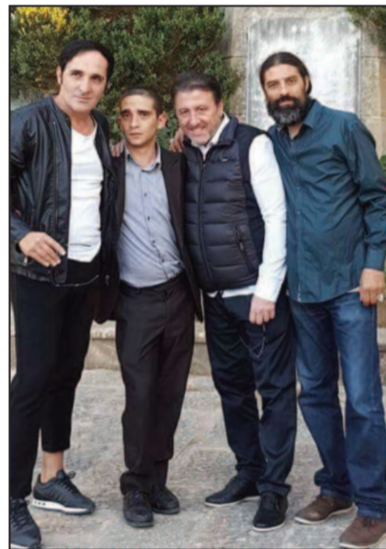
ALCUNI ATTORI DI "GIANO"