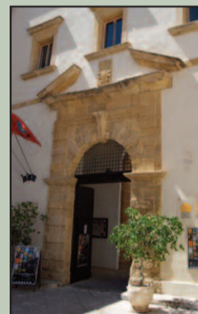
CONVENTO DEL CARMINE