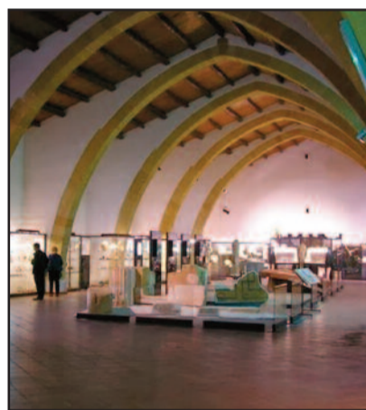
L'INTERNO DEL MUSEO LILIBEO

ciatione Beni Italiani Patrimonio Unesco, nonché delle più importanti città d'arte e di molte regioni. Il Museo "Lilibeo", famoso per il relitto della Nave punica, partecipa con il tema "E' arrivata una nave carica di...", dedicato al Mare Mediterraneo, luogo di incontro e scontro di popoli, dall'antichità ad oggi. L'iniziativa del Museo di Marsala inizierà alle ore 16 con una visita guidata ai reperti archeologici subacquei, dal relitto della Nave Punica con i suoi materiali di bordo, alle anfore da trasporto e le ancore, un racconto ambientato nel Mare Nostrum. I protagonisti saranno i marinai e i mercanti che lo hanno solcato con le navi da trasporto, cariche di merci, o con le navi da combattimento. Di fronte a Marsala nelle acque delle Egadi gli equipaggi di Roma e Cartagine si scontrarono nella faticosa battaglia che nel 241 a.C. pose fine alla Prima Guerra Punica. Al termine del racconto, verrà proposta un'attività di Laboratorio creativo ai ragazzi tra i 6 e i 12 anni che, con