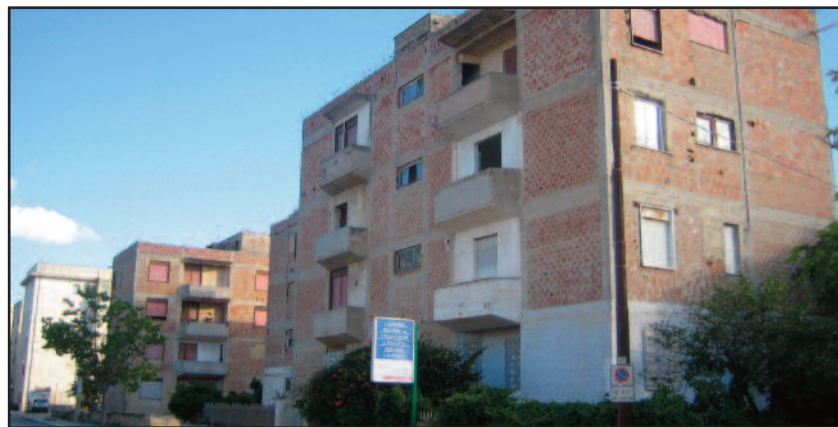
LE PALAZZINE DI VIA MAZARA