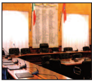
SALA DELLE LAPIDE