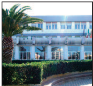
IL LICEO SCIENTIFICO "P. RUGGIERI"