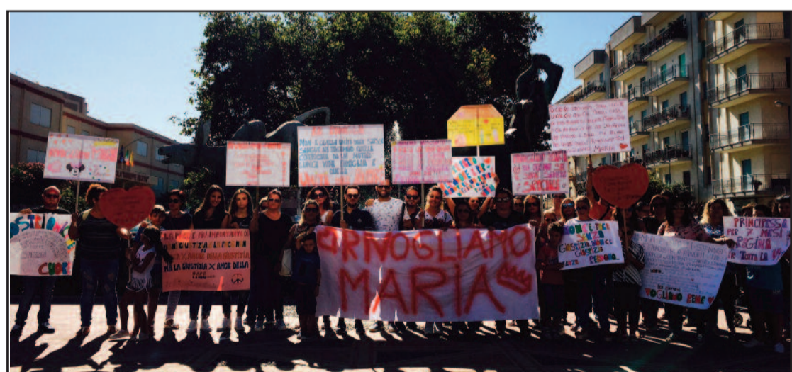
LA PARTENZA DEL CORTEO