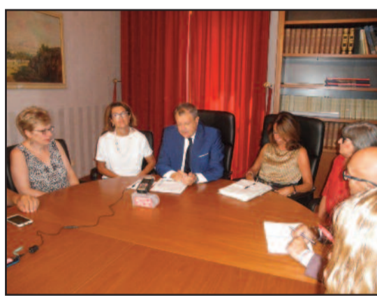
UN MOMENTO DELLA CONFERENZA STAMPA