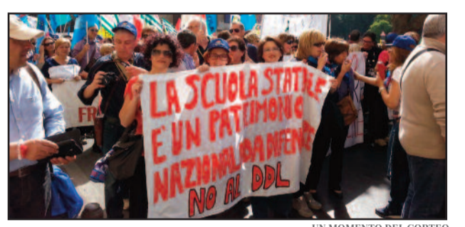
UN MOMENTO DEL CORTEO