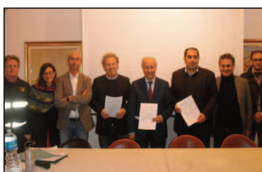
UN MOMENTO DELLA FIRMA DEL PROTOCOLLO

Firmato ieri mattina, come era stato previsto, il protocollo tra il comune di Marsala e la O-I, società che ha rilevato da tempo quella che i marsalesi hanno imparato a conoscere come la Sicilvetro. Si tratta di un atto che si inquadra nella politica di risparmio idrico e che si è reso sempre più necessario vista la siccità che sta portando all'esaurimento, o quanto meno al forte depauperamento, della falda acquifera che rifornisce la città di Marsala, a causa della diminuzione, stimata oltre il 30% delle precipitazioni "La nostra città - ha detto il sindaco introducendo i lavori della conferenza nella sede istituzionale dei piazza Carmine - ha in dotazione un depuratore delle acque provenienti dalle reti fognati. Si tratta