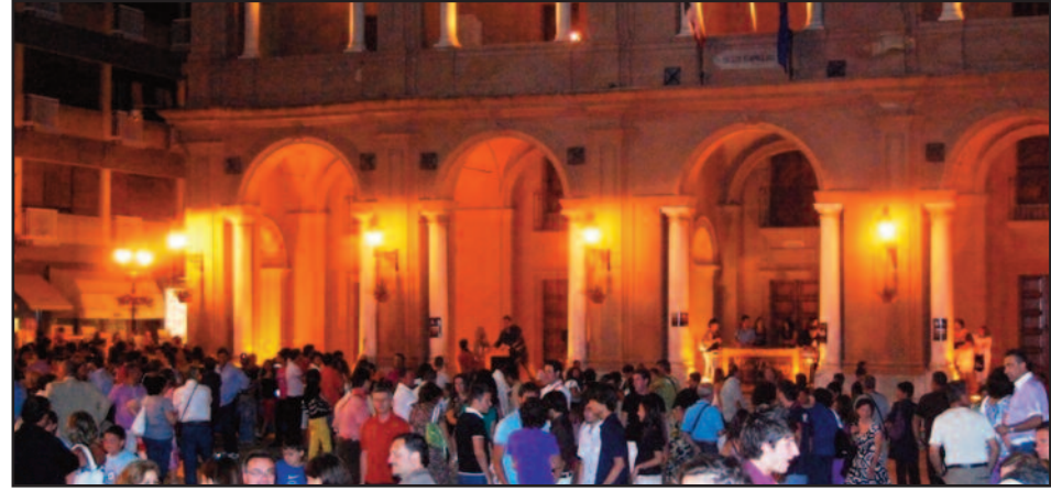
FESTEGGIAMENTI A MARSALA

Qualcuno, non in molti per la verità, ha chiesto alla nostra redazione di capire che cosa accadrà alle manifestazioni in programma nell'estate in corso e che fine faranno gli impegni (anche di spesa) che la Giunta Adamo aveva preso per allietare il periodo estivo del marsalesi. Così abbiamo fatto una ricerca e appurato che tutto (o quasi) viene annullato. Da premettere che le note vicende che hanno portato alle dimissioni del sindaco sono datate pochi giorni fa e le manifestazioni estive (se si esclude il cinema in piazza), non erano cominciate e non c'era nessun cartellone delle stesse. Quindi diciamo come isvuole, l'amministrazione era in notevole ritardo. Sappiamo con certezza che