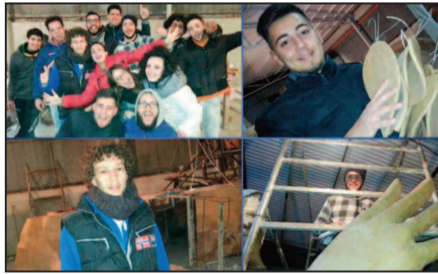
L'ASSOCIAZIONE A LAVORO