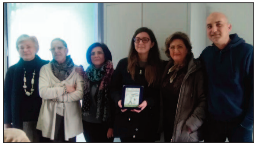
UN MOMENTO DELLA PREMIAZIONE