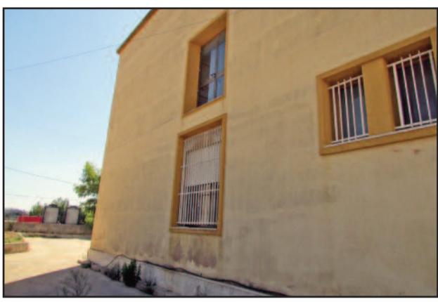
LA PARTE DELL'EDIFICIO DOVE MANCA LA SCALA D'EMERGENZA