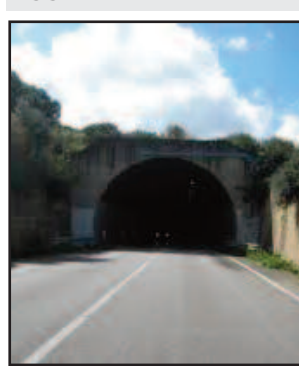
UN TRATTO DELLO SCORRIMENTO VELOCE

Sarà l'impresa "S.V. Costruzioni" di Messina ad eseguire i lavori di manutenzione straordinaria sullo scorrimento veloce "Marsala-Birgi", la strada statale 188 "Marsala-Salemi" e le sedi varie limitrofe. Le risultanze di gara, come comunicato dalla CUC (Centrale Unica di Committenza), hanno visto l'aggiudicazione alla suddetta ditta - su oltre trenta partecipanti - che ha offerto un ribasso di quasi il 12% sull'importo a base asta di poco meno di 120 mila euro. Gli interventi riguarderanno il ripristino del manto bituminoso, la ricollocazione di pavimentazioni nei marciapiedi, nonché ogni altro lavoro volto al miglioramento delle rete viaria interessata. Al momento, non si sa ancora quando gli interventi verranno effettuati e se verrà disposta la temporanea chiusura al traffico delle arterie viarie interessate.