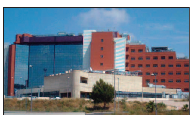
OSPEDALE "PAOLO BORSELLINO"