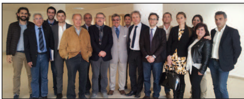
UN MOMENTO DEL SOPRALLUOGO