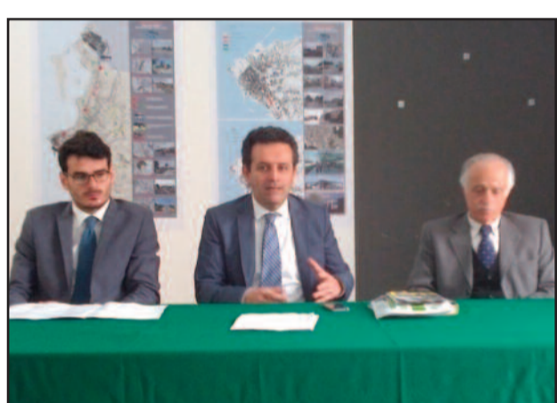
UN MOMENTO DELLA CONFERENZA STAMPA