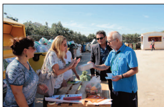
UN MOMENTO DELL'INIZIATIVA

gestito dall'Associazione Eteologica. "È un modo simpatico per incentivare a differenziare le diverse tipologie di rifiuto - afferma il vicesindaco Licari -; il personale dà consigli, aiutando altresì a leggere le confezioni dei prodotti alimentari che indicano come smaltire gli involucri". Ai cittadini meritevoli, ovvero a quelli che commettono meno errori nel differenziare i rifiuti, un piccolo omaggio: tovaglioli e piatti compostabili (vanno conferiti nell'organico) offerti dagli sponsor.