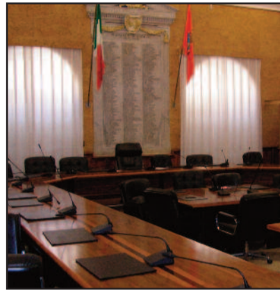
SALA DELLE LAPIDI